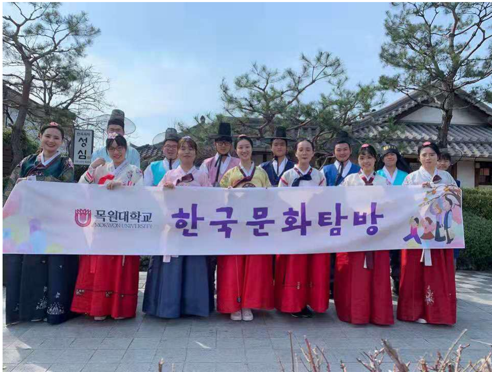
中国留学生参加韩国文化探访