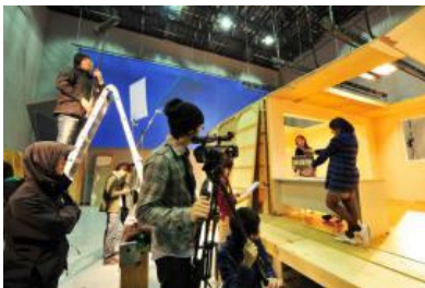
电影及动画制作课程

国内专科在校期间，参加牧园大学本科前置课程和语言集中授课，拿到专科毕业证书后，9 月登陆韩国进行国外一年的本科段课程学习。