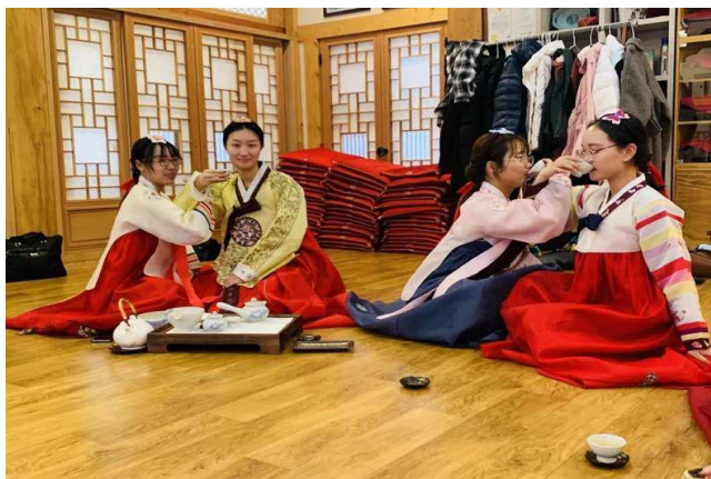
中国留学生韩国文化课