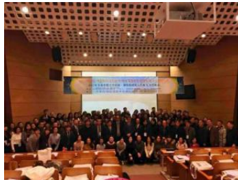
开学典礼合影留念